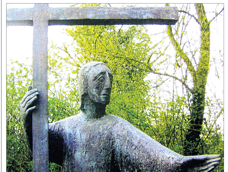
Die zweite Station des Bückler-Kreuzwegs »Kreuzannahme«.