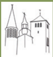
Jesus Christus Lippetal

Leben und Verkündigung Jesu Christi, dessen Wirken durch seinen Tod am Kreuz und seine Auferstehung nach christlichem Glauben zur Erlösungstat wurde, sind Inhalt unserer Lippetaler Passionsspiele. Sie möchten Darstellern und Zuschauern Auge und Ohr sowie Herz und Verstand öffnen, damit sie angerührt von dieser Botschaft deren Bedeutung für ihr eigenes Leben erkennen und so zu Betroffenen werden. Die Aufführungen im Frühjahr 2014 wurden zu einem unvergesslichen Glaubenszeugnis und haben dieses Ziel in beeindruckender Weise erreicht.